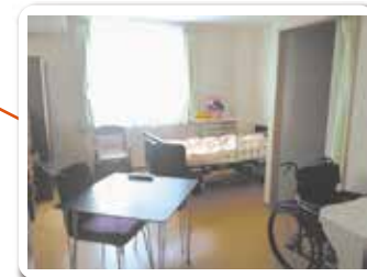
※各居室。個室 約18㎡ 洗面・トイレ付