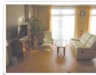
※日当たりのよい共有スペース